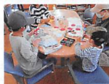
こいのぼり作成中→