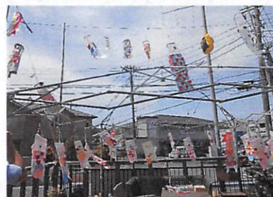
↑こいのぼりをデイサービスで掲げました。