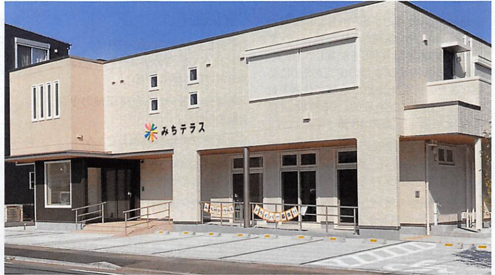
2022年7月25日に新事務所みちテラス1階にて、営業開始しました。

ご対応させていただくことが出来なかったご要望・ご質問等がございましたら、当センターまでお問い合わせください。今後とも地域交流スペースの活用も含め、様々なアイデアや、ご要望をお寄せください。まずは、書中にて御礼申し上げます。(M.M.)