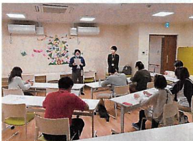
地域交流スペースを使用して行った勉強会の様子

この活動にご協力いただける方は、4月以降の新年度に声をかけさせていただきますので、当センターまでご協力くださる意思をお伝えください。