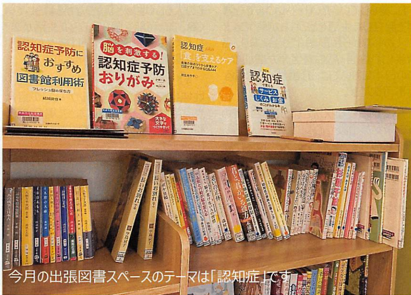
今月の出張図書スペースのテーマは「認知症」です。