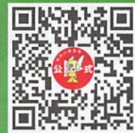
神奈川県警察防犯大使 藤田愛理さんと学ぶ 子供安全対策「おおだこボリス4つのおやくそく」