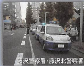
藤沢警察署・藤沢北警察署