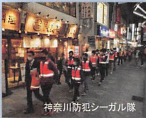
神奈川県防犯シーガル隊

問合せ先 神奈川県自転車商協同組合 TEL045-311-6168 http://www.kanasho.jp