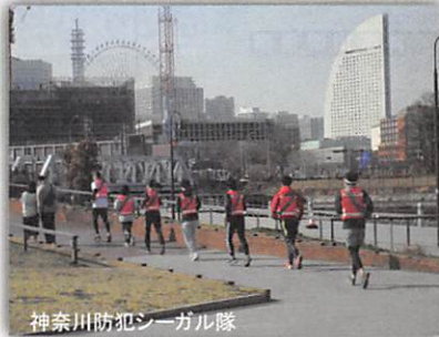
神奈川防犯シーガル隊