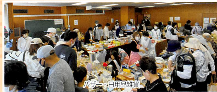
バザー・日用品雑貨