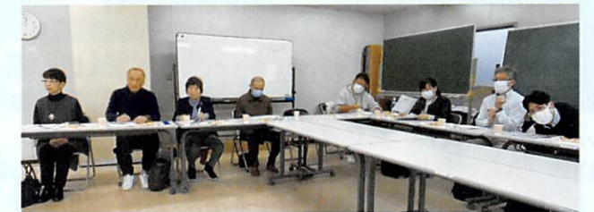
▲交流会 双方から総勢21名が参加

発足時の苦労話、現在の活動状況・課題など話し合いました。活動で最も多いのは、高齢家庭での除草・庭木の刈込そして家内での力仕事など。課題は、ボランティア活動を志向する後継者不足で、いずれも共通していました。