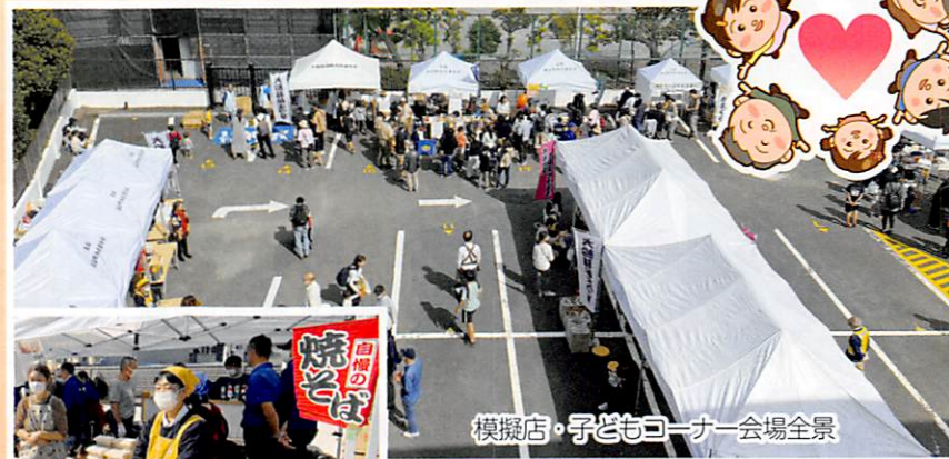
模擬店・子どもコーナー会場全景

屋外の駐車場では、前回好評の子ども向けコーナーが再現され、各種の模擬店を巡りながら遊ぶ子どもたちの笑顔があふれ、屋内では恒例の福祉バザーや、地域包括支援センター職員の協力による健康相談コーナーが開設されるなど、大勢の来場者が穏やかな秋晴れの1日を楽しんで下さいました。(尾島 記)