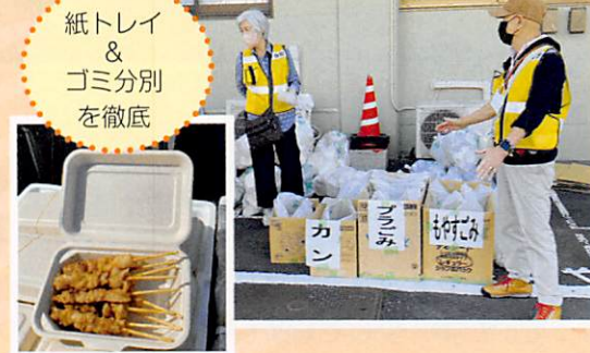
紙トレイ & ゴミ分別を徹底